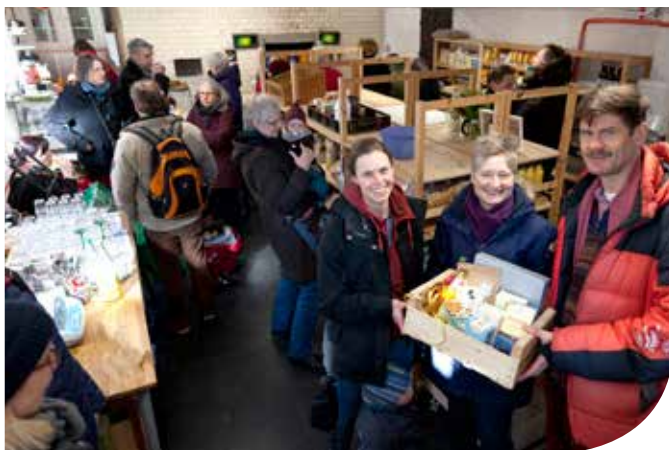
Grafik: Markus Keuler | Layout: Klaus-Peter Land

Nach gemeinsamem gründlichen Renovieren endlich geschafft: Am 3. März 2018 feierten wir die Körnerklub-Laden-Eröffnung mit vielen leckeren Kostproben.